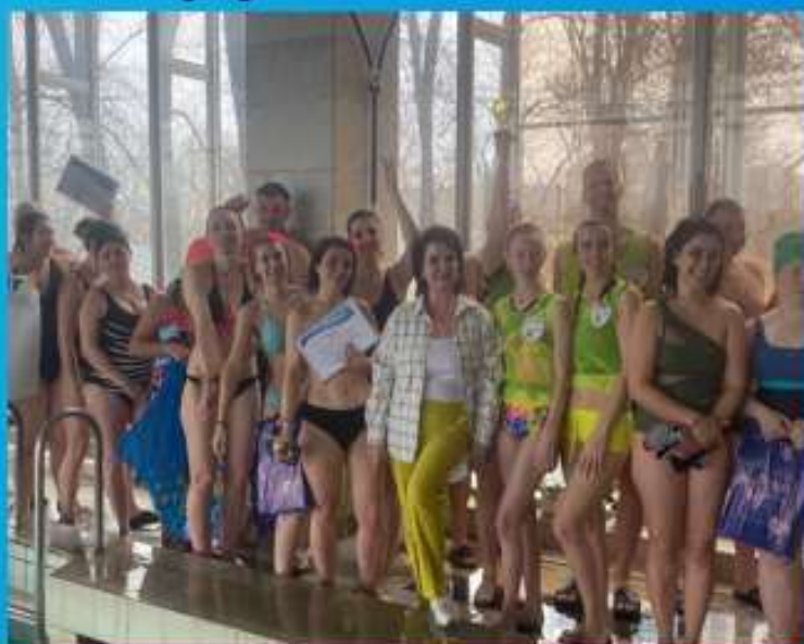
МКДОУ детский сад 15 "Колосок"